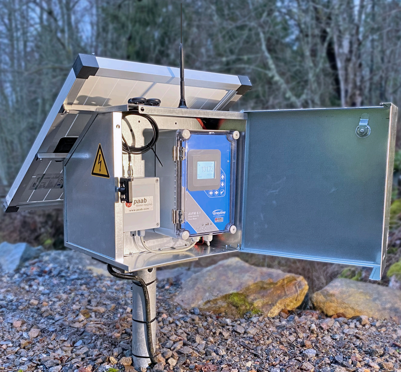
Mätstation med trådlös signalöverföring, solcell och batteri, installerad för fjärrövervakning av flöde i öppen kanal

Våra silosäkerhetssystem, produkter för vätskeanalys och flödesmätning samt våra trådlösa lösningar med batteridrift och solcell är typiska produkter som bidrar till ett hållbart samhälle.